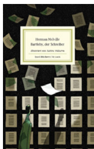
Herman Melville (Autor von «Moby Dick») Bartleby, der Schreiber